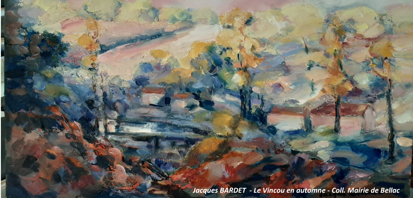
Jacques BARDET - Le Vincou en automne - Coll. Mairie de Bellac