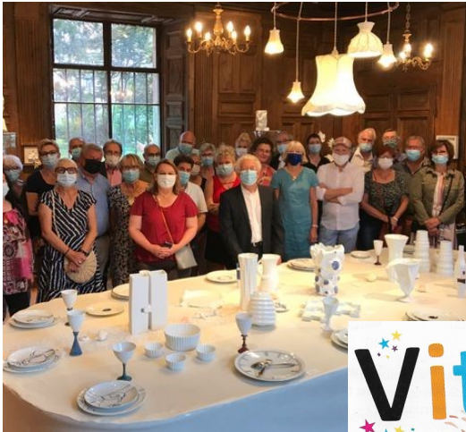
plus de 500 visiteurs à l'exposition ESPRIT DE PORCELAINE de la mairie.