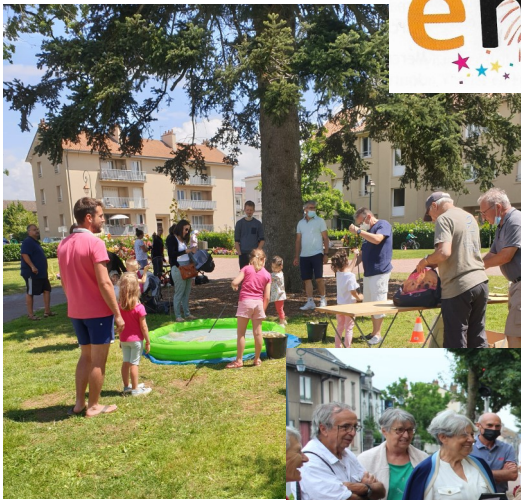
Grand succès de la journée des enfants.