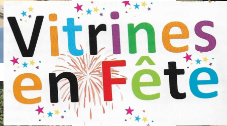
« VITRINES EN FETE » a parfaitement répondu aux attentes .