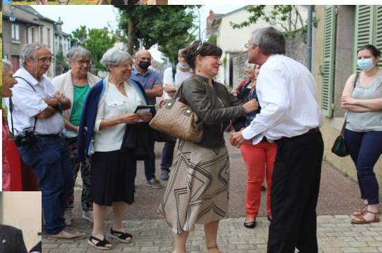
On s'est précipité à la maison de Jean GIRAUDOUX qui a accueilli plus de 1000 visiteurs.