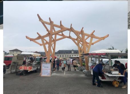
Un très bon cru pour le 67 ème FESTIVAL NATIONAL DE BELLAC .