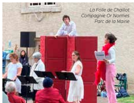
La Folle de Chaillot Compagnie Or Normes Parc de la Mairie

La salle d'honneur de la mairie a, elle, accueilli une exposition de peintures et de sculptures pendant le mois d'août.