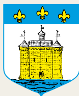
Ville de Bellac